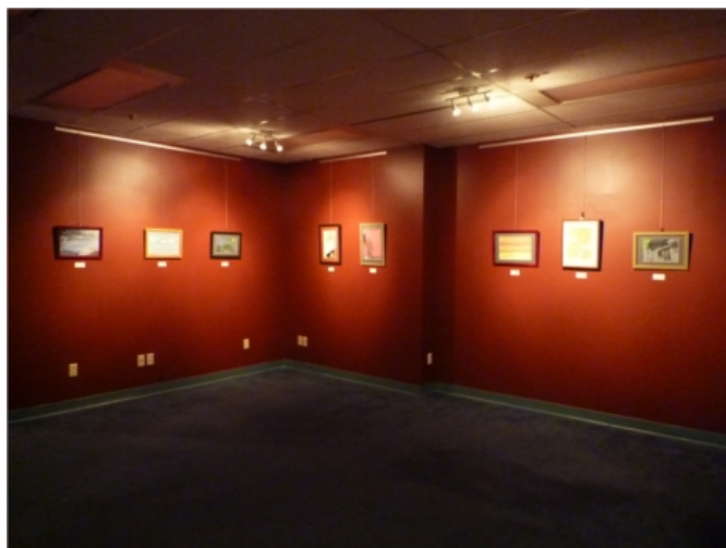
(メイン・ディスプレイエリア)

2010年冬季オリンピック開催の地カナダ・バンクーバーで、日本人画家の「日本」をテーマとした絵画のみを展示するという新コンセプトの基に待望のルーファス・リン・ギャラリーが2009年12月にオープンしました。現在、すでに取り扱い画家は11名。選考委員会によりプロ・アマ、男女、年齢を問わず、新鮮さのある作品を随時選考中。